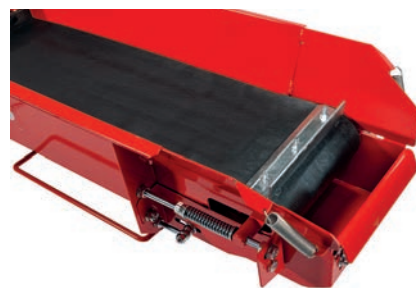
Patentované čistící zařízení na vykládacím dopravníku ve standardu. Drážka na konci vykládacího dopravníku slouží k odstranění třísek a zbytků.