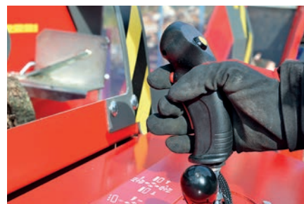
Elektrické ovládání řezání a štípacího cyklu pomocí dvou tlačítek.